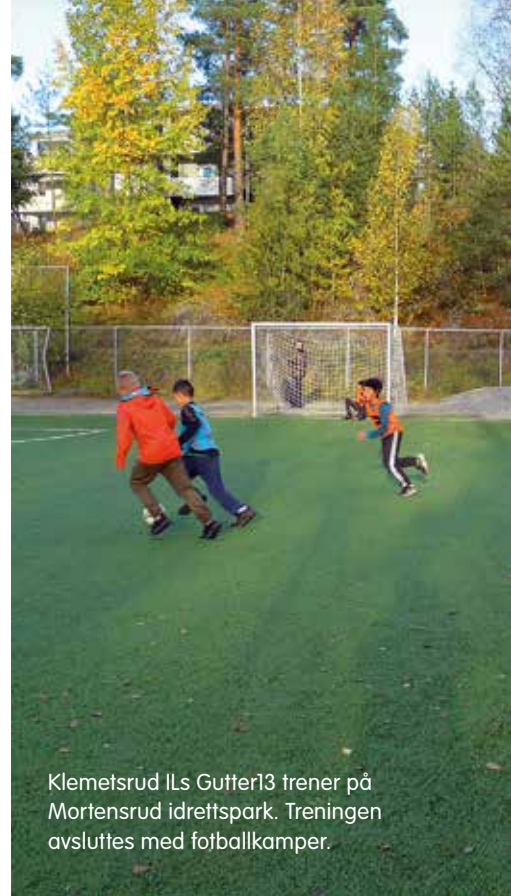
Klemetsrud ILs Gutter13 trener på Mortensrud idrettspark. Treningen avsluttes med fotballkamper.

Klemetsrud IL er 100 år i desember. I KIL finner nesten 700 medlemmer et svært variert idrettstilbud. Flest spiller fotball.